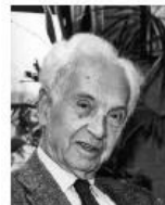
Ernst Mayr (1904-2005)

Pour Cuvier , une espèce peut être définie comme la collection de tous les corps organisés nés les uns des autres ou de parents communs et de ceux qui leur ressemblent autant qu'ils ne se ressemblent entre eux.