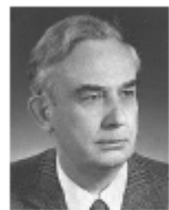
Willi Hennig (1913-1976)

* niche écologique : ensembles des ressources et des habitats.