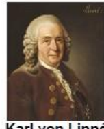
Karl von Linné (1707-1778)

Pour Ray , une espèce est l'ensemble de tous les variants qui sont potentiellement les rejetons des mêmes parents.