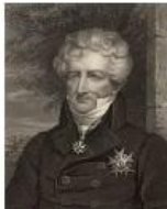
Georges Cuvier (1769- 1832)

Pour Buffon , une espèce est une succession constante d'individus similaires qui peuvent se reproduire ensemble.