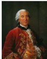
George Buffon (1707-1788)

Pour lui, une espèce regroupe tous les être vivants qui se ressemblent. L'espèce est définie par comparaison avec un individu de référence conservé en muséum et qui a servi à décrire l'espèce, c'est le type.